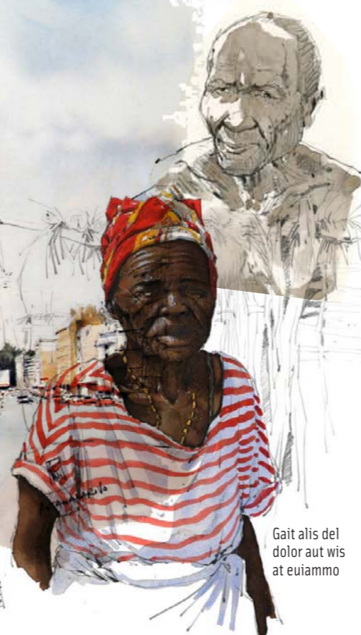
Gait alis del dolor aut wis at euiammo