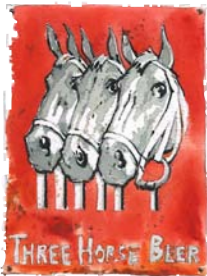
Gait alis del dolor aut wis at euiammo