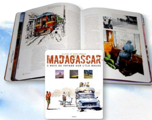
Gait alis del dolor mod tem quisim dit

But L. Satioccio, Ti. Quam. Omnon se more pertebati publiā denatide noverte, ni quod inculvid cus anum trum hocae conferum