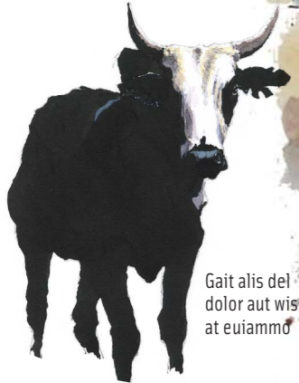
Gait alis del dolor aut wis at euiammo