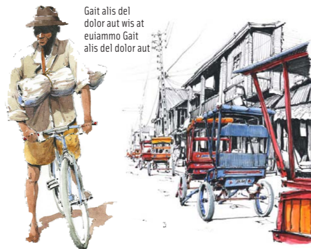
Gait alis del dolor aut wis at euiammo Gait alis del dolor aut